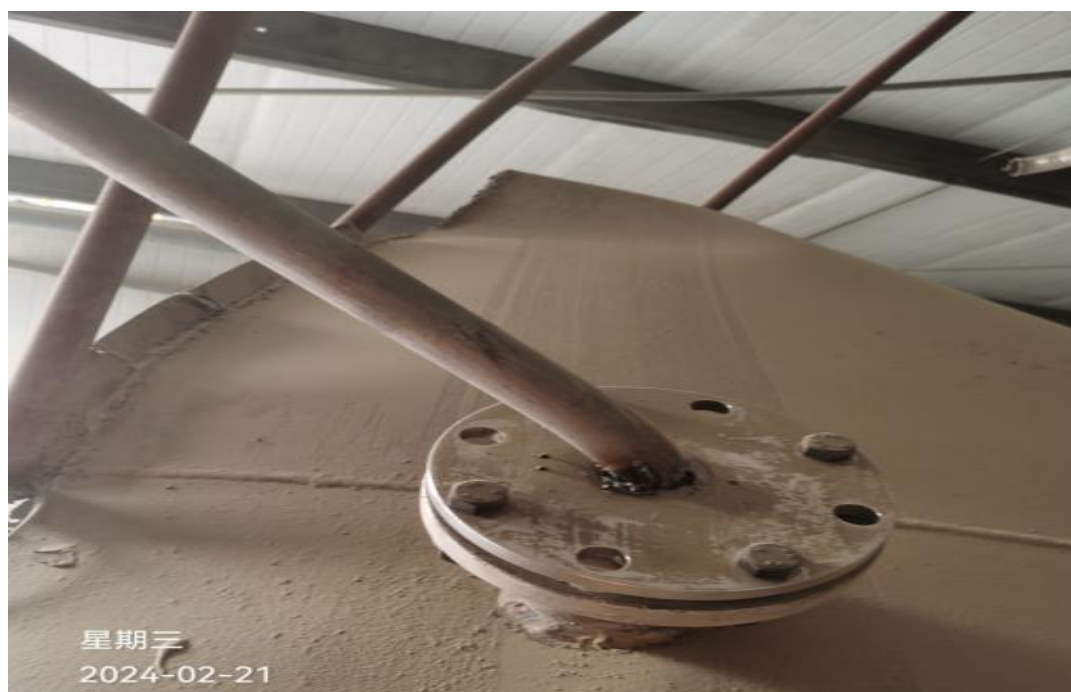
图2 事故焊接作业点位