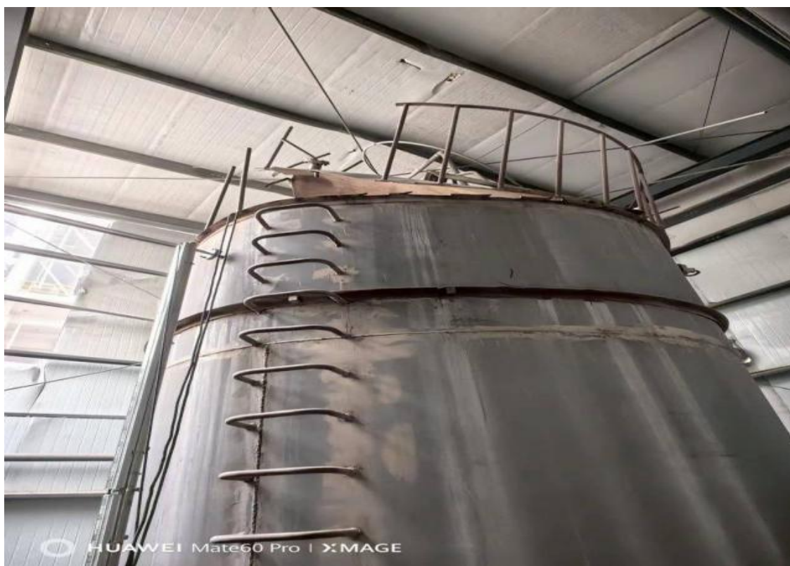
图 3 事故现场闪爆位置