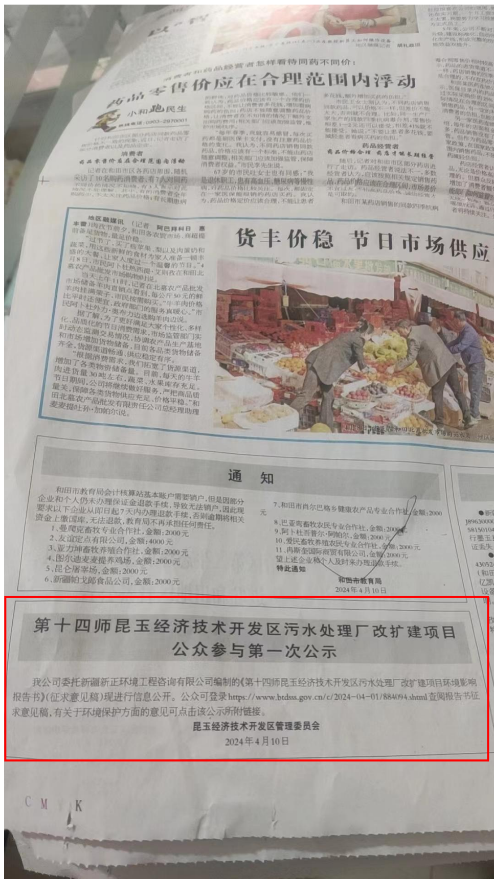
图4 征求意见稿第二次报纸公示截图