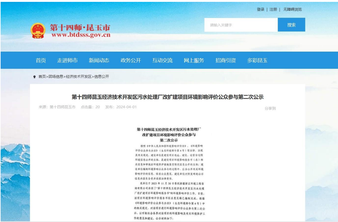
图 2 本项目征求意见稿网络公示截图