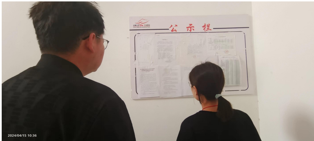
图 5 公告张贴现场照片

昆玉经济技术开发区管理委员会于 2024 年 4 月 1 日在昆玉市经济开发区公示栏张贴公告，公示起止时间为 2024 年 4 月 1 日~2024 年 4 月 16 日，张贴公告选取项目所在地居民易于知悉场所，符合《环境影响评价公众参与办法》要求。公告张贴现场照片见图 5。